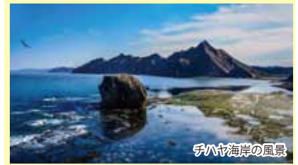
チハヤ海岸の風景